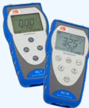
Multiparametri PC 7 - PC 70