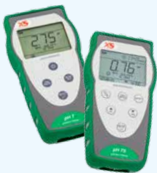
pHmetri pH 7 - pH 70

Una linea completa di strumenti portatili impermeabili e testers per pH, conducibilità e ORP nella misura in campo.