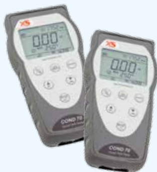
Conduttimetri COND 7 - COND 70