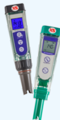
pH-COND-PC-ORP Tester a tenuta stagna